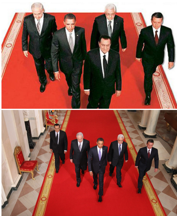
Figura 3. Acima, foto publicada no Al Ahram . Abaixo, foto original.