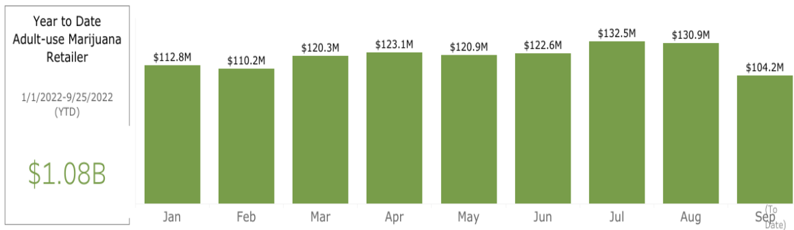
GRAFICO 3 Ventas minoristas de Cannabis para uso adultos Enero- Septiembre 2022 15

Massachusetts los impuestos recaudados por las ventas de cannabis en el 2021 superaron los de las bebidas alcohólicas. A finales de 2021, el estado había recaudado un total de 74,2 millones de dólares en impuestos de cannabis mientras que en el mismo periodo los impuestos por las ventas de alcohol supusieron un ingreso 51,3 millones para el Estado 16 .