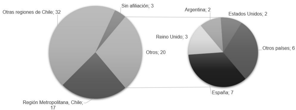
Figura N°2. Autoras y autores del corpus, según su afiliación institucional.

titución ubicada en Chile, de estas, 17 se encuentran en la Región Metropolitana y las otras 32 son de instituciones de diversas regiones del país (Ver Figura 2). Por otro lado, 17 personas son parte de instituciones ubicadas en el extranjero: 7 personas pertenecientes a instituciones de España, 3 de Reino Unido, 2 de Argentina, 2 de Estados Unidos y otras 6 personas de diferentes instituciones en otros países de Europa, Oceanía y América Latina.