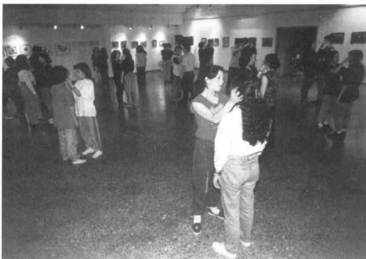
Taller de Pedagogía Teatral para Monitores Nacionales. INJ. Santiago, 1994.